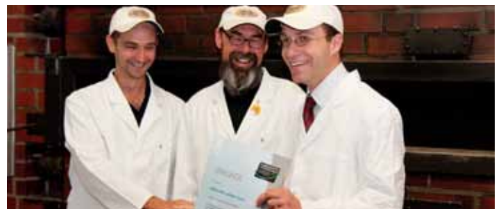
Urkundenübergabe bei der Berliner Bio-Bäckerei Märkisches Landbrot